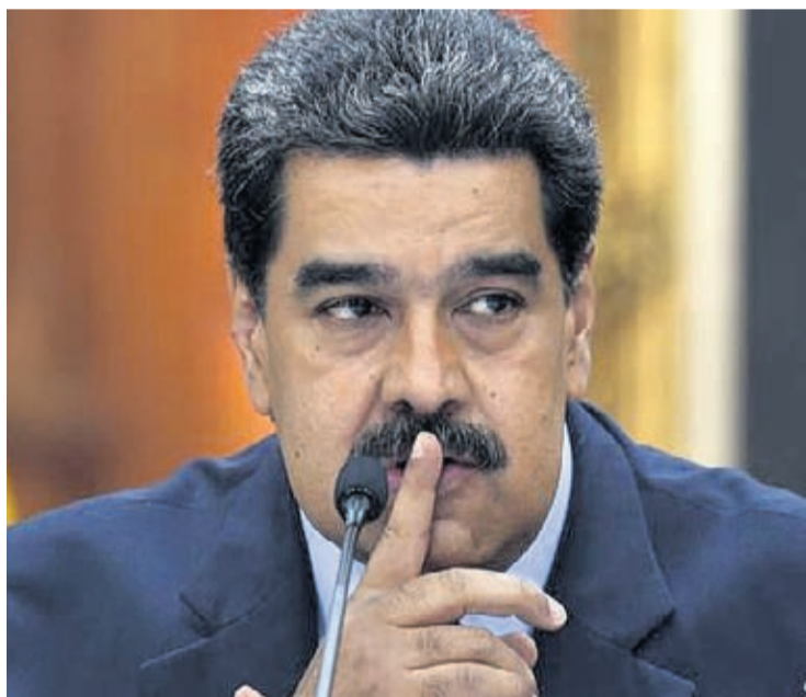
Jorge Arreaza, canciyer di e regimen di Nicolas Maduro y Alto Representante di Union

Europeo pa Asunto Exterior y Política di Seguridad, Josep Borrel, den un conversacion telefonico a acorda 'promove e contactonan diplomatico' entre e partidonan na nivel mas halto, esaki den un 'di cooperacion sincero y di respet pa derecho internacional'.